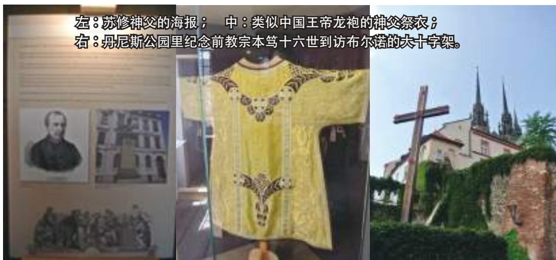
左：苏修神父的海报；中：类似中国帝王龙袍的神父祭衣；右：丹尼斯公园里纪念前教宗本笃十六世到访布尔诺的大十字架。

(Moravské národní písně) 里共有超过两千首的歌曲！除了民歌，苏修神父也为教会创作了许多礼仪歌曲。此外，精通多国语言的他更将新约翻译成捷克语。笔者随后也上了圣堂右侧的南塔。这儿的展示厅有圣堂多年来的礼仪用品——当中较吸引笔者眼目的为一件类似皇帝龙袍的神父祭衣。