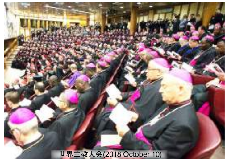
世界主教大会(2018 October 10)

文件在最后阐述了需要深入认识的十个核心主题，使咨询得以充实。这些主题都是有关“生活