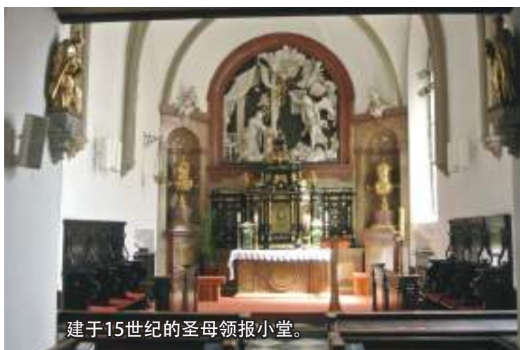
建于15世纪的圣母领报小堂。

此外，主教座堂也附属着两个小堂。其2005年落成的圣体小堂 (Blessed Sacrament Chapel) 可说是此堂最新的设置（其他部分都在百年以上），位于圣堂左侧的祭台之间。另一个附有历史价值的小堂——圣母领报小堂 (Chapel of Annunciation)，则位于祭台的右侧。圣堂的记录显示，此小堂建于15世纪，原名为圣母升天小堂，1795年以后改为圣母领报小堂。其祭台处的浮雕甚是美观，显示着总领天使加俾厄尔 (St Gabriel) 向圣母宣告她即将怀孕生子的喜讯；此浮雕也为大殿的祭台及读经台的设计师——士威哥而的作品。其巴洛克式的圣体柜则为1652年维也纳主教的赠品。资料显示，此木制镶金的圣体柜原本是设在主堂内，因此堂被提升为主教座堂而被迁至此小堂。