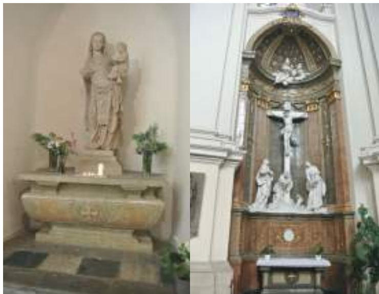
左：源自13世纪初的歌德式圣母圣婴像。

笔者拿着导览手册内仔细地欣赏圣堂内的各种艺术作品——圣堂大殿左右两侧的6个祭台，有各自的风格，但都非常地壮观。有的祭台是以油画的方式呈现，有的则刻有圣人的雕像。其18世纪建成的巴洛克式读经台，及祭台间墙上挂着栩栩如生的苦路像，也同样吸引着笔者的眼球。圣堂里尚有一个重要的文物，在许多旅游网站皆有推介——源自13世纪初的歌德式圣母圣婴像（英语名称为Madonna；编注：此词汇源自意大利文——ma donna，意即圣母），安置在圣堂的后部。