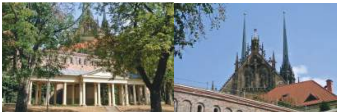
左：丹尼斯公园；右：从丹尼斯公园眺望主教座堂。

南塔下来后，笔者遂拜别主教座堂，到座堂毗邻、同在彼得罗夫山上的丹尼斯公园 (Denis Gardens) 去溜达。此古老的公园于1771年起对外开放。原本称为 Frantiskov 的公园于1919年改名为丹尼斯公园，为纪念协助捷克斯洛伐克 (Czechoslovakia) 立国的法国历史学家丹尼斯 (Ernest Denis；注：捷克斯洛伐克于1993年解体，成为两个独立国家——捷克共和国及斯洛伐克共和国)。由于丹尼斯公园位于彼得罗夫山上，得以眺望布尔诺市区的多个部分。公园的中心为一个设立于1818年为纪念拿破仑战争结束的纪念碑；而公园的东南端则设有一个高达12米的金属十字架，以纪念前教宗本笃十六世于2009年到访布尔诺。此简单的十字架的特别之处在于其玻璃罐的装置以代表耶稣基督的五伤。从丹尼斯公园下来后，笔者遂拖着手提行李乘搭电车前往处于郊外的旅馆去，打算小休一下才于傍晚时分到市区去观光。